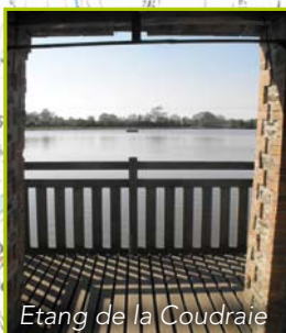
Etang de la Coudraie