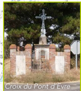
Croix du Pont d'Evre