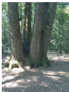
Les 6 chênes