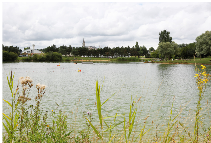
Étang du Petit Anjou