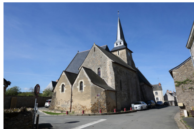
Église Saint-Martin de Vertou - XII e siècle (Chenillé-Champteussé, Champteussé-sur-Baconne)