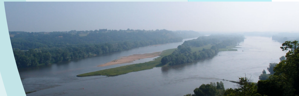
La Loire, l'île Neuve depuis le promontoire du Champalud à Champtoceaux - Orée d'Anjou.