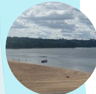
Les rives de Loire