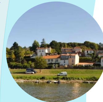
Le patrimoine bâti