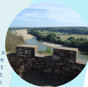
Le patrimoine historique