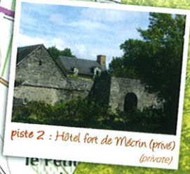
piste 2 : Hôtel fort de Mécrin (privé) (private)

▲ CIRCUIT NON-BALISÉ / NOT MARKED OUT FOOTPATH