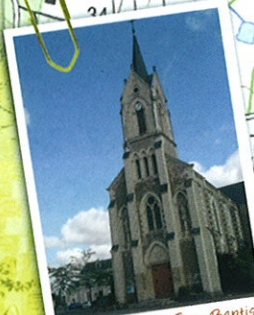
piste 1 : Eglise St-Jean-Baptiste Church of St-Jean-Baptiste