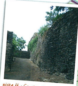
piste 4 : Constructions en schiste Schist constructions