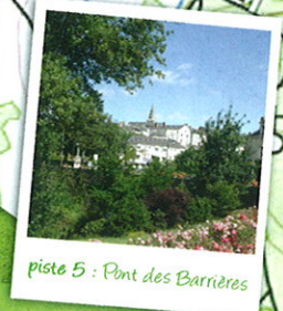
piste 5 : Pont des Barrières