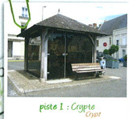
piste 1 : Crypte Crypt