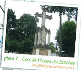
piste 7 : Croix de Mission des Barrières The Barrières mission cross