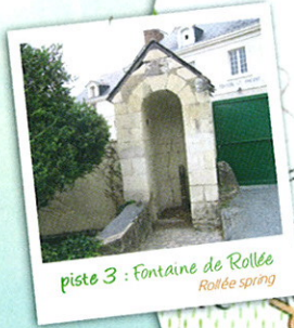
piste 3 : Fontaine de Rollée Rollée spring