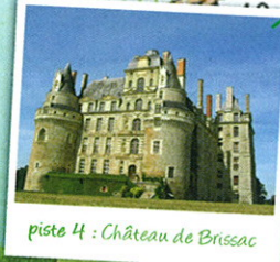
piste 4 : Château de Brissac