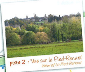
piste 2 : Vue sur le Pied-Renaud View of Le Pied-Renaud