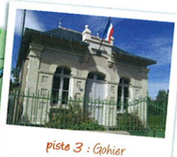
piste 3 : Gohier