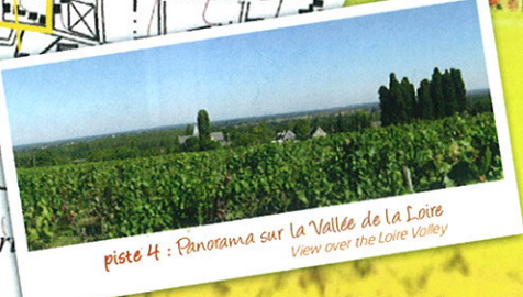
piste 4 : Panorama sur la Vallée de la Loire View over the Loire Valley

▲ CIRCUIT NON-BALISÉ / NOT MARKED OUT FOOTPATH