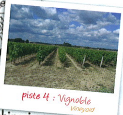
piste 4 : Vignoble Vineyard