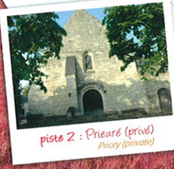
piste 2 : Prieuré (privé) Priory (private)