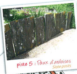
piste 5 : Poux d'ardoises Slate posts