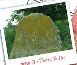
piste 3 : Pierre Tu Fis