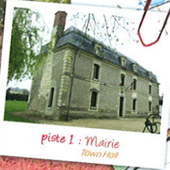
piste 1 : Mairie Town Hall