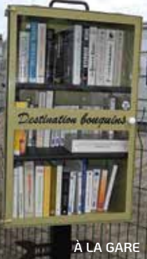
À LA GARE