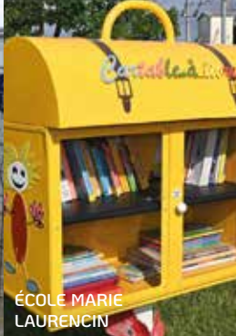
ÉCOLE MARIE LAURENCIN