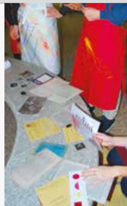
Musées de Cholet