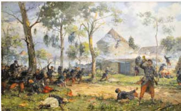
La bataille de Mondement / René Rousseau-Decelle - Mathilde Richard