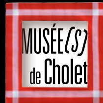
MUSÉE DU TEXTILE ET DE LA MODE