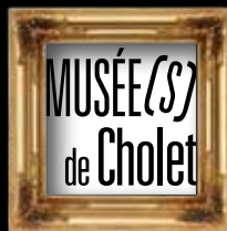
MUSÉE D'ART ET D'HISTOIRE

Tous les samedis du 1 er octobre au 31 mai, l'entrée des Musées de Cholet est gratuite pour tous.