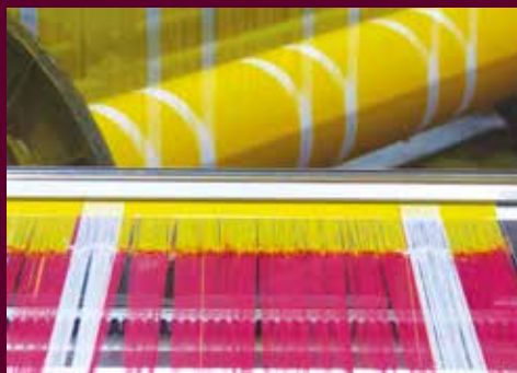
CP - Musées de Cholet

Le mouchoir de Cholet, dont la couleur rouge symbolise le sang des Vendéens, se fait jaune en l'honneur du Tour de France qui fera étape dans la ville le 9 juillet 2018. Sur le métier à tisser du Musée du Textile et de la Mode, dédié à la fabrication de la toile du mouchoir, les fils teintés de jaune sont venus remplacer les rouges. Un foulard a également été créé pour l'occasion.