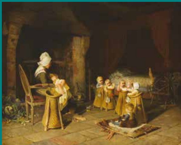
J. Pierre Haag, La grand-mère d'enfants, collection Las Pêcheres, Musée de Fécamp