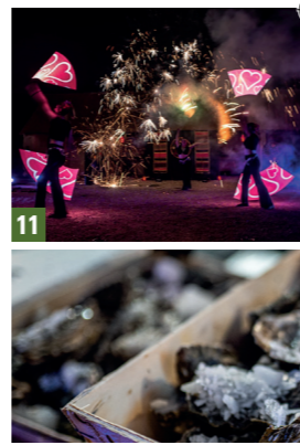
11. Compagnie Luminescence