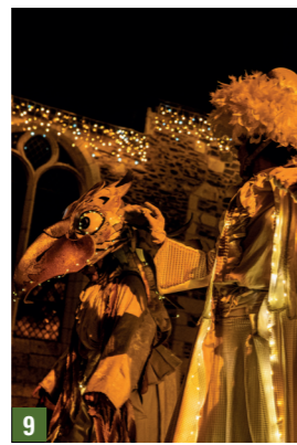
9. Denée / 10. Le Puy Notre Dame