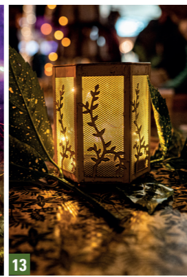
12. Compagnie Luminescence / 13. Ingrandes - Le Fresne