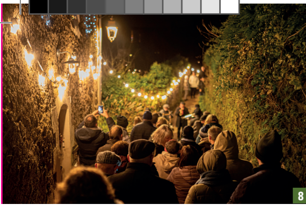
8. Saint Florent le Vieil