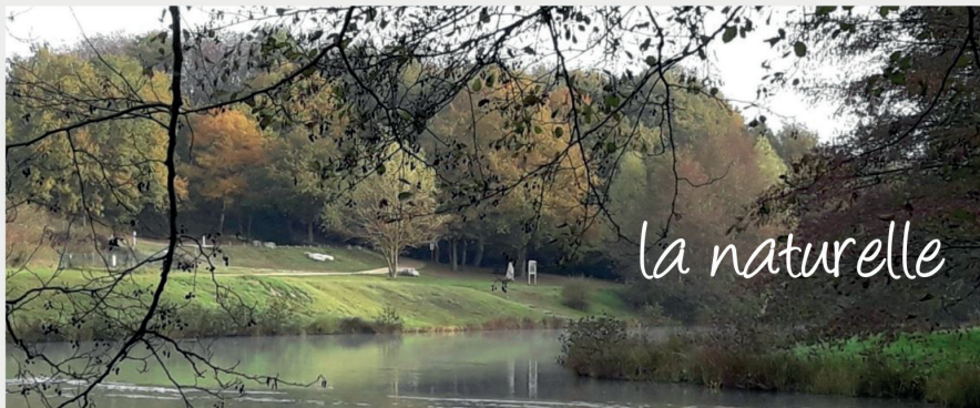
PLAN D'EAU DE BAUGÉ