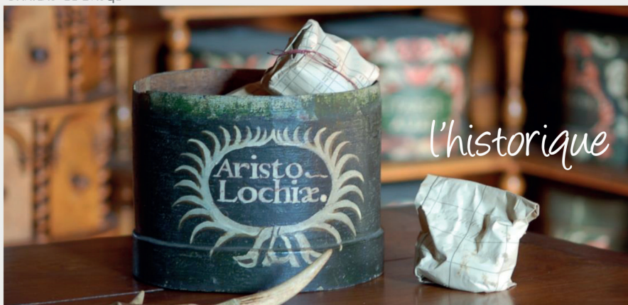
APOTHIKAÏRIÈRE DE BAUGÉ