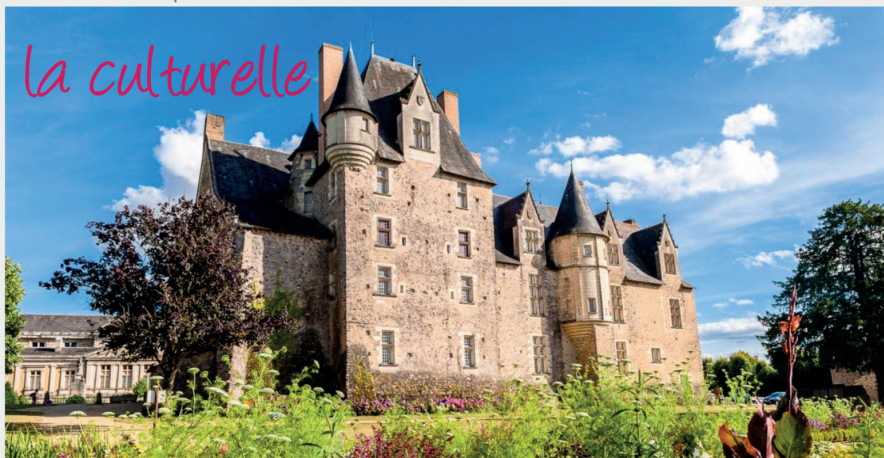
CHÂTEAU DE BAUGÉ