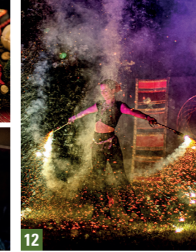
12. Compagnie Luminescence / 13. Ingrandes - Le Fresne