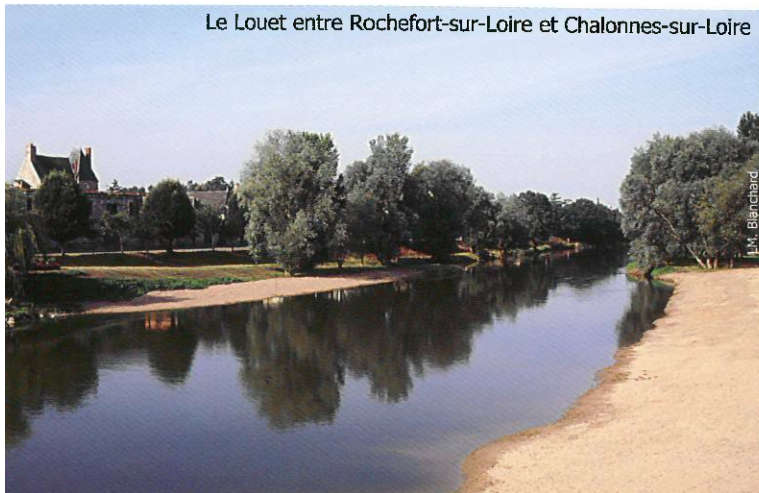
Le Louet entre Rochefort-sur-Loire et Chalonnes-sur-Loire