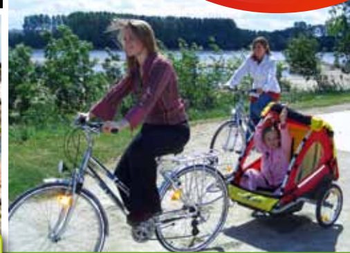
Ingrandes / Le Fresne-sur-loire : frontière historique entre la Bretagne et l'Anjou