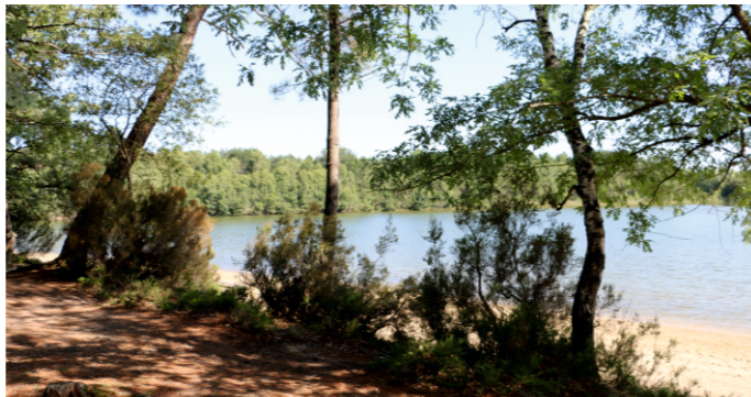
Base de loisirs de Malagué à Chaumont d'Anjou

HORAIRES D'OUVERTURE Du 1 er mai au 30 septembre Mardi au samedi : 10h - 13h / 14h - 18h Fermé le dimanche en mai et juin Ouvert les dimanches de juillet, août et 2 dimanches en septembre : 10h - 14h