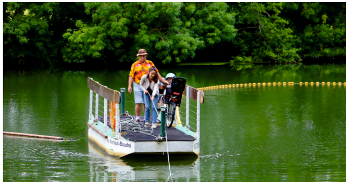
Bac de Montreuil-sur-Loir