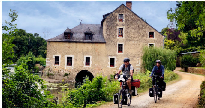
Moulin de Matheflon