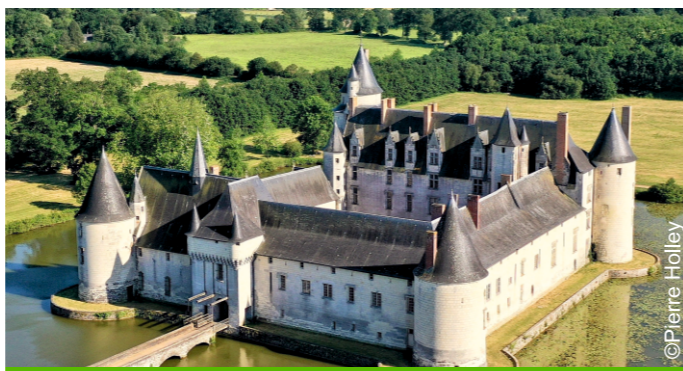
Château du Plessis-Bourré à Ecuillé