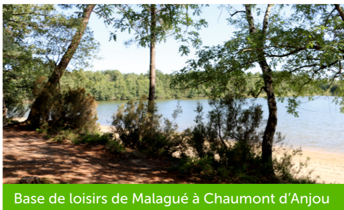
Base de loisirs de Malagué à Chaumont d'Anjou