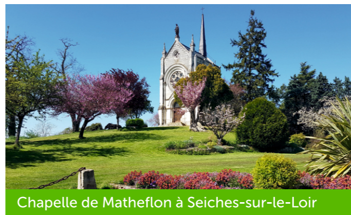
Chapelle de Matheflon à Seiches-sur-le-Loir