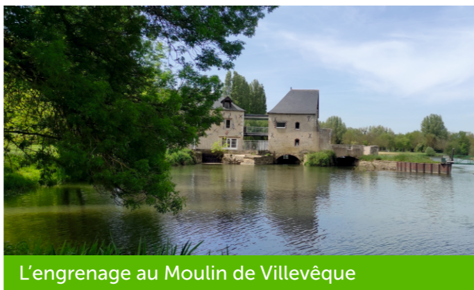
L'engrenage au Moulin de Villevêque