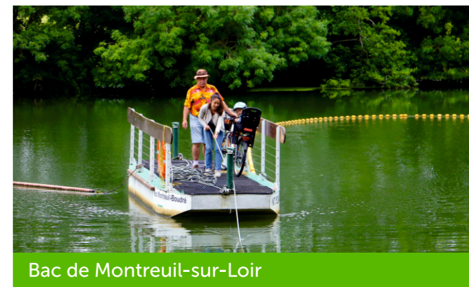
Bac de Montreuil-sur-Loir