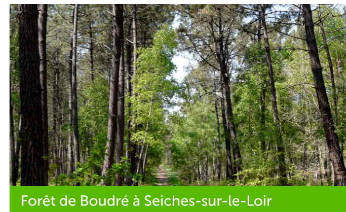
Forêt de Boudré à Seiches-sur-le-Loir