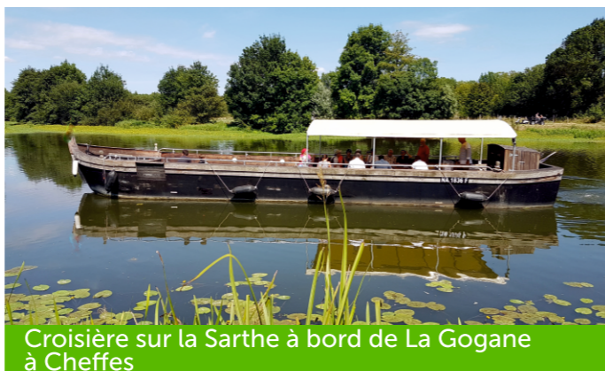
Croisière sur la Sarthe à bord de La Gogane à Cheffes