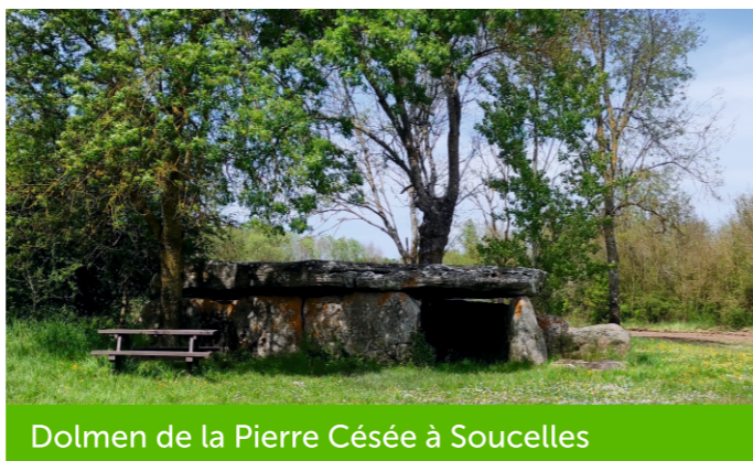
Dolmen de la Pierre Césée à Soucelles