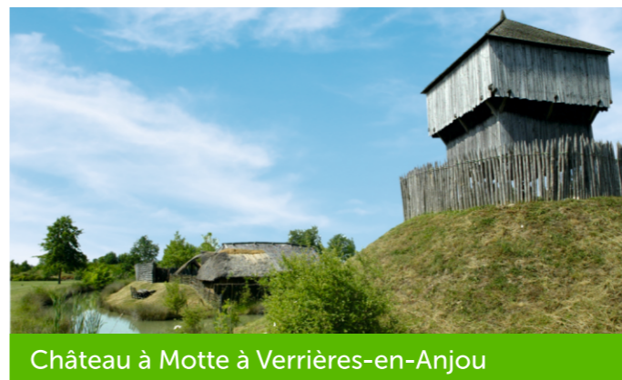
Château à Motte à Verrières-en-Anjou