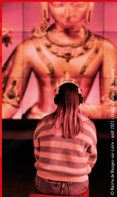
© Mairie de Mauges-sur-Loire - août 2023 - Crédits photos : B. Béchard