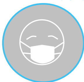
Port du masque obligatoire À partir de 11 ans

NOUS COMPTONS SUR VOUS POUR RESPECTER LES GESTES BARRIÈRES !