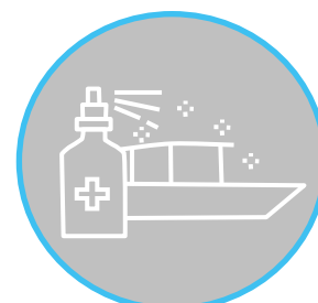
Bateau désinfecté entre chaque croisière