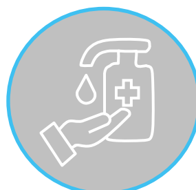
Nettoyage des mains avec gel hydroalcoolique