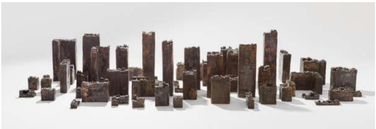
Ci-dessus : Antoine Birot, Cité, sculpture bronze, 2018.

Antoine Birot est un artiste angevin, né en 1974, qui vit et travaille à Rochefort-sur-Loire. Formé dans un premier temps à la musique, sa production artistique s'est ouverte progressivement à de nombreux champs de création. Il aborde par ses travaux aussi bien la sculpture, la performance, l'installation, la vidéo, que la conception de spectacles ou de musiques de films.