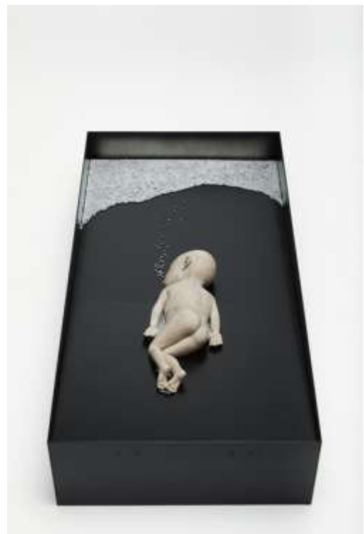
Ci-dessus : Antoine Birot, l'enfant et la mer, installation, 2019.

Antoine Birot veille sur toutes les étapes de la création, depuis la forme en bois, l'empreinte, le moule, le coulage en cire, la cuisson, le coulage du bronze jusqu'aux ultimes finitions.