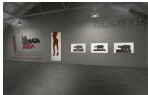
Ci-contre : Collectif 9/14, exposition virtuelle, 2014.

Une application 3D a ainsi été intégrée au site de la galerie de 2013 à 2017. Elle a permis de présenter plusieurs expositions virtuelles, regroupant des artistes qui n'avaient jamais eu l'occasion d'exposer ensemble en utilisant le support numérique comme une nouvelle force de proposition artistique. Les nouvelles orientations du numérique ont cependant rendu, depuis 2017, cette application inutilisable pour le grand public, mais des versions vidéos de ces expositions restent accessibles sur la chaîne de la galerie.