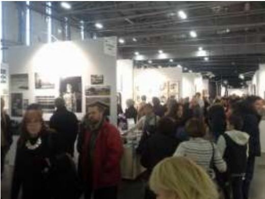
Ci-contre : La corbata rosa au Salon international d'art contemporain de Nantes.

Créée en 2013, la corbata rosa est une galerie d'art actuel dont l'objectif est de favoriser l'acquisition d'œuvres d'art actuel par le grand public et les professionnels. Elle présente des artistes vivants, déjà connus et exposés, afin de diffuser et commercialiser leurs travaux dans le cadre d'expositions temporaires, permanentes et sur internet.