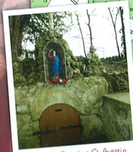
piste 2 : Fontaine St Avertin et Statue Saint Avertin's spring and statue