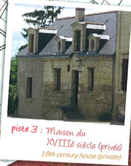
piste 3 : Maison du XVIII e siècle (privée) 18th century house (private)

▲ CIRCUIT NON-BALISÉ / NOT MARKED OUT FOOTPATH