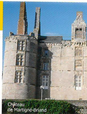
Château de Martigné-Briand