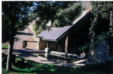
Le lavoir de Mâchelles

Circuit entre vignes et cultures, entre haies bocagères et bois. Passage dans le village de Faveraye (site inscrit)